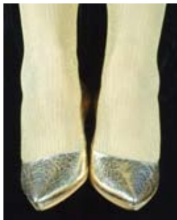
4 Maria Lucrezia Schiavarelli Sotto Biancaneve Loggia Musei Civici, piazza XX Settembre, 4/h