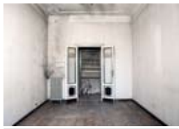
1 Simona Barbagallo NudeStanze_InvolucriUmani Libreria Zazie via Del Teatro, 4