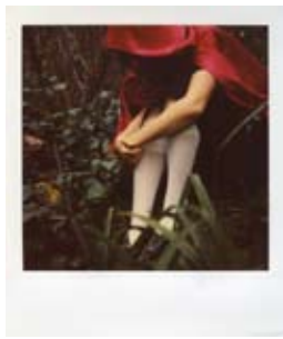
3 Caterina Curzola Little Red Cap Caffè Centrale, corso Matteotti, 104